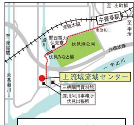
伏見出張所(会議室)